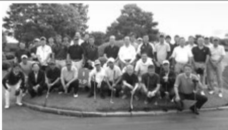
親睦を深めた参加者