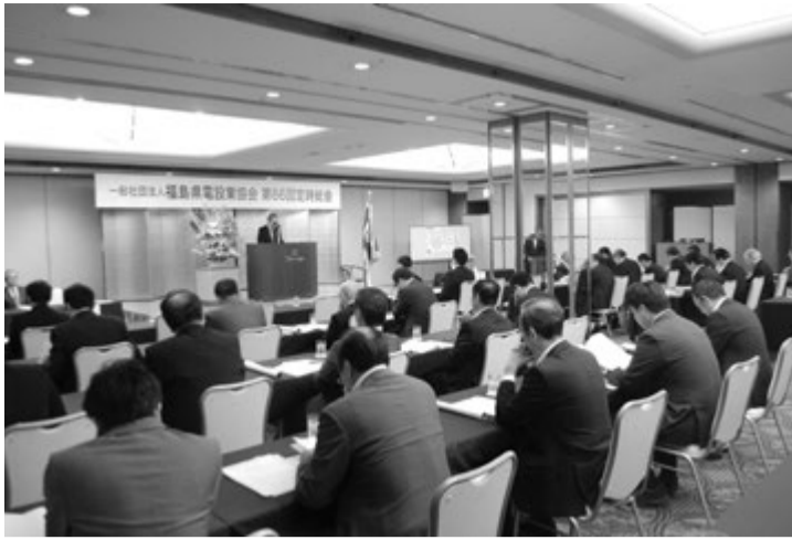
今年度事業計画などを決めた総会