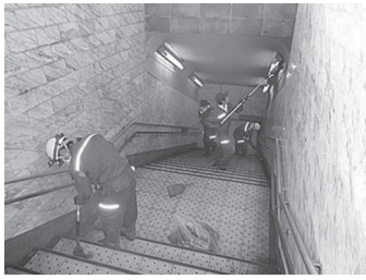
地下歩道を清掃する支部会員

福島支部は8月の第1週、東北建設事務所管内の地下歩道14カ所を清掃しました。道の日美化作戦として平成16年度から実施しているもので、会員10社から66人が参加しました。