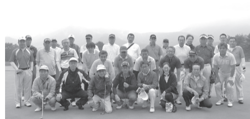
親睦を深めた参加者

当協会の第10回親善ゴルフ大会が6月6日、猪苗代町のボナリ高原ゴルフクラブで開かれ、正会員、賛助会員、友好団体から31人が参加し、プレーを楽しみながら交流を深めた。