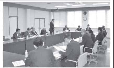
あいさつする大槻会長