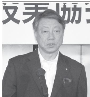
大槻会長 て、今年度も引き続き、①総務②技術・安全③広報の各委員会が

総会には会員45人が出席した。冒頭、大槻会長が「復興・創生期間も残り2年となった。県内各地の好景気も一段落し、新たに働き方改革が、われわれの業界を取り巻く労働