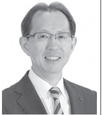
福島県知事 内堀 雅雄