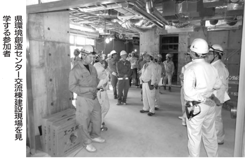
環境創造センター交流棟建設現場を見学する参加者