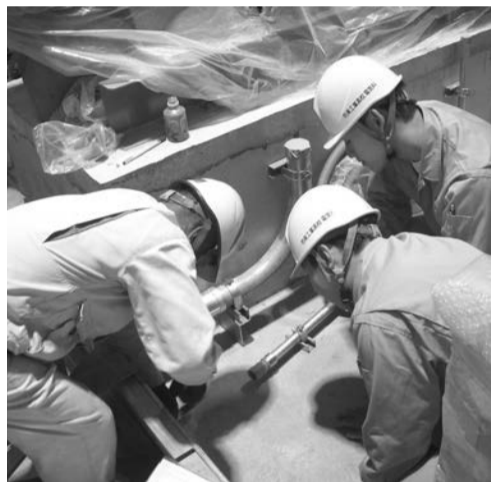
実習を行う生徒ら

いわき支部は10月20日 設備工事業に関する理解 和電設工業▽1日目は現場見学、現場実習▽2日 昇立勿来工業高校電気科 実施概要は次の通り。 2年生12人のインターンシップを受け入れた。生徒らは3班に分かれ、各担当企業の下で、現場見学や実習などのカリキュラムをこなす。電気(Auto, CAD)◆大