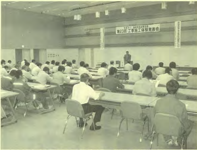
9月17日に郡山市で開催された発表会