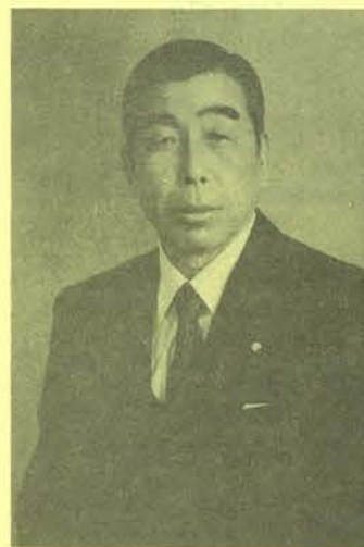
社団法人 福島県電設業協会