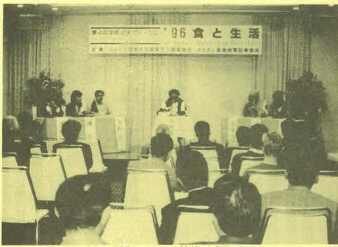
第一部のフレンドリートーク

本協会と(財)県空調衛生工事業協会(矯正光会長)の共催による第四回国際交流フォーラムは十二月十五日、午後二時から福島市のホテルサンルートプラザ福島で行われ、県内在住の外国人(九カ国・十二人)と会員、それに市民の有志者約八十人が参加し賑やかに進められた。 「食と生活、体験ふくしまのソバ」と題して行われたフォーラムは、二部構成で行われた。第一部のフレンドリー