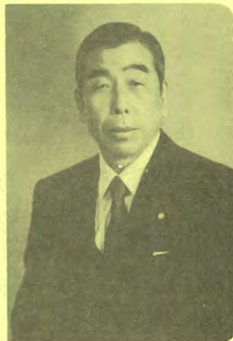
社団法人 福島県電設業協会 会長