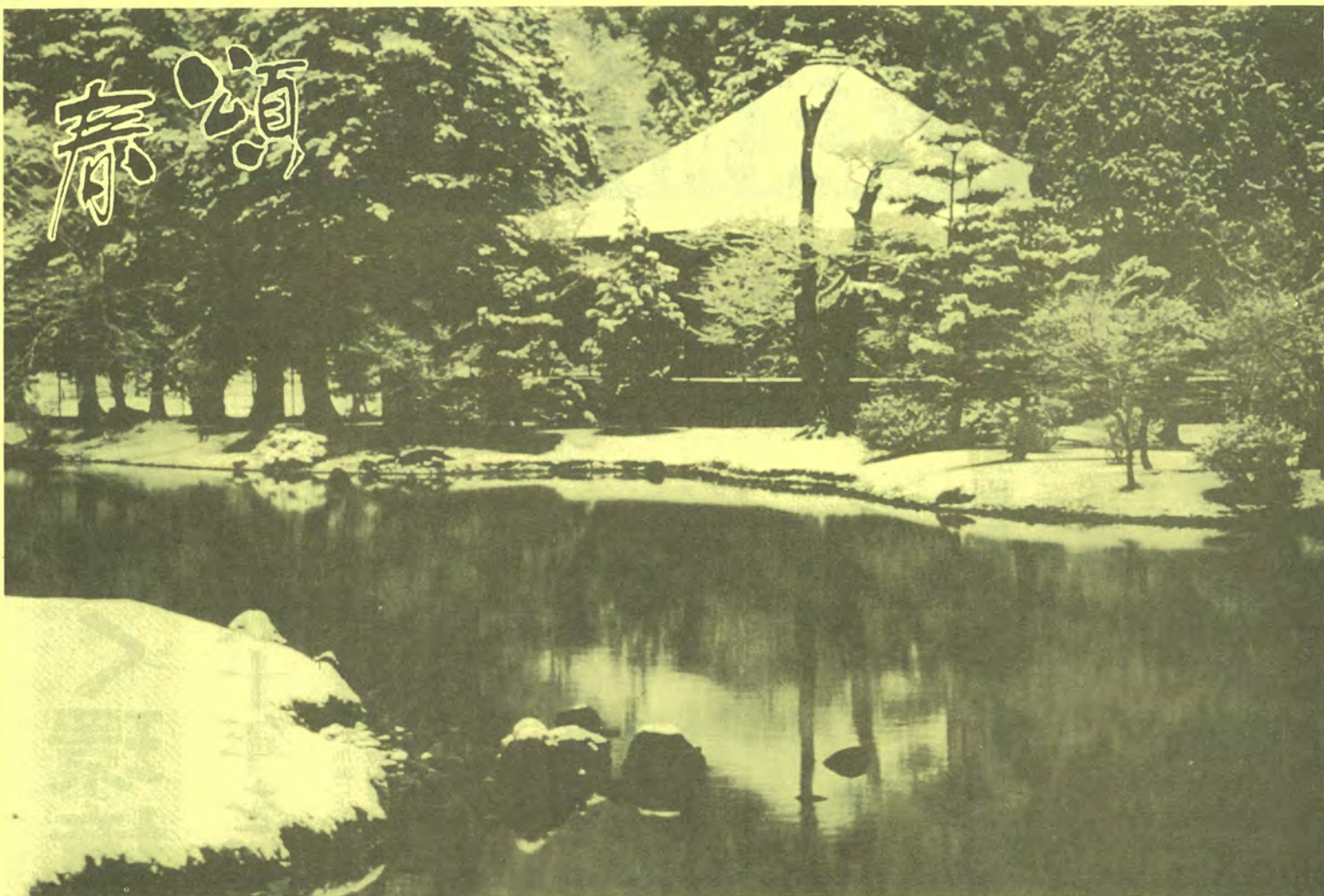
静寂/国宝 白水阿弥陀堂 (いわき市)