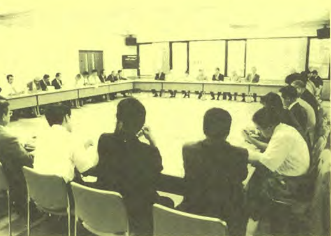
昨年開かれた県公共建築・住宅連絡会

私は、県政の執行に際しましては、引き続き簡素で効率的な行政運営に努めながら、新たな本県の飛躍のために全力を尽くしてまいりますので、今後とも、一層の御支援をお願い申し上げます。