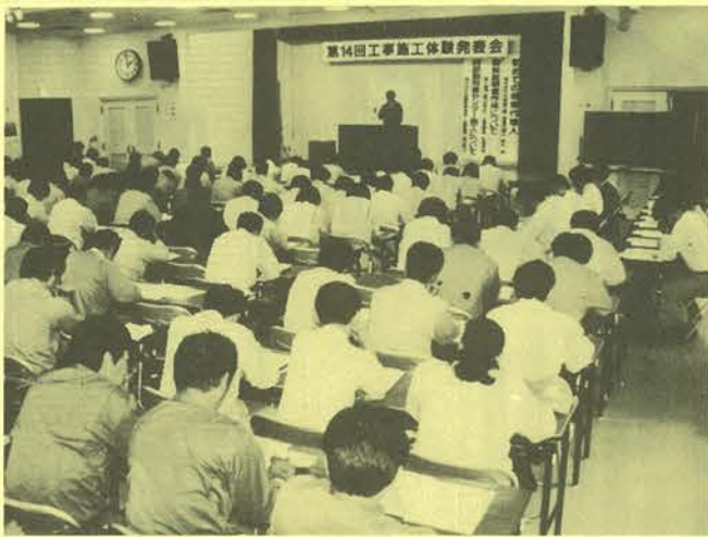
自治体の設備関係者も多数出席した発表会