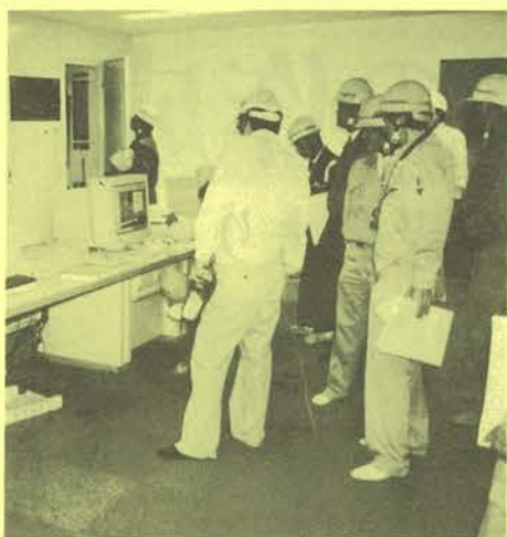
担当者から説明を受ける参加者