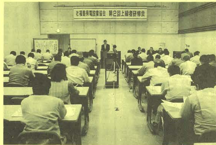
郡山市で開催した第2回上級者研修会

線第三課長を講師に、リニューアル工事の概要をはじめ、チェックリストを用いた安全管理、技術提案書作成などに関する講義を受けた。この中で講師は、リニューアル工事が一般的に建築物を使用しながら進めるケースが多く、工法の選定や工事の進め方、工事の時期を検討しながら設備の機能低下を防ぐとともに、使用者の安全やセキュリティに配慮することの必要性を強調した。