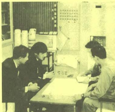
担当教師との定例協議会