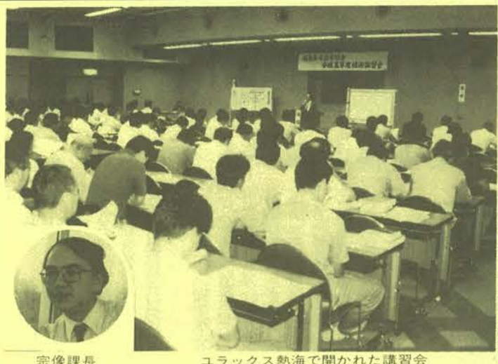
宗像課長 ユラックス熱海で開かれた講習会