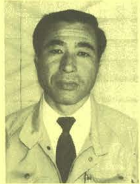
太陽電設(株) 技術部長