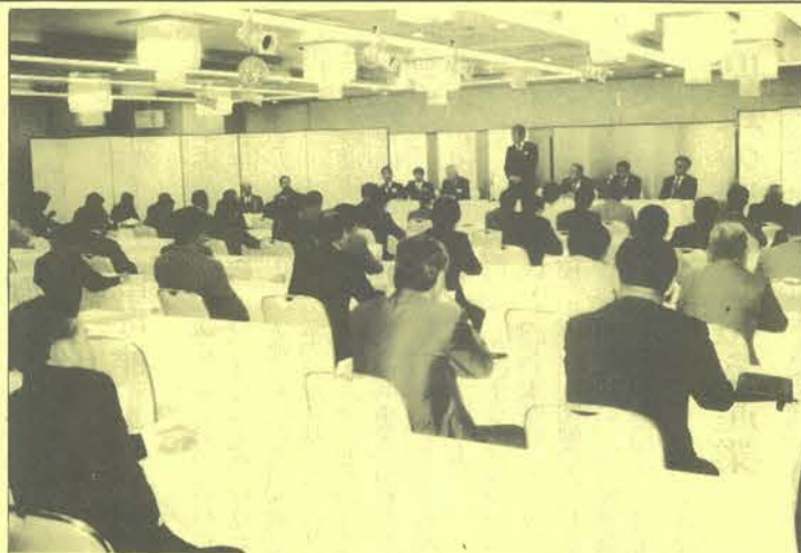
福島ビューホテルで開かれた3技士会の研修会