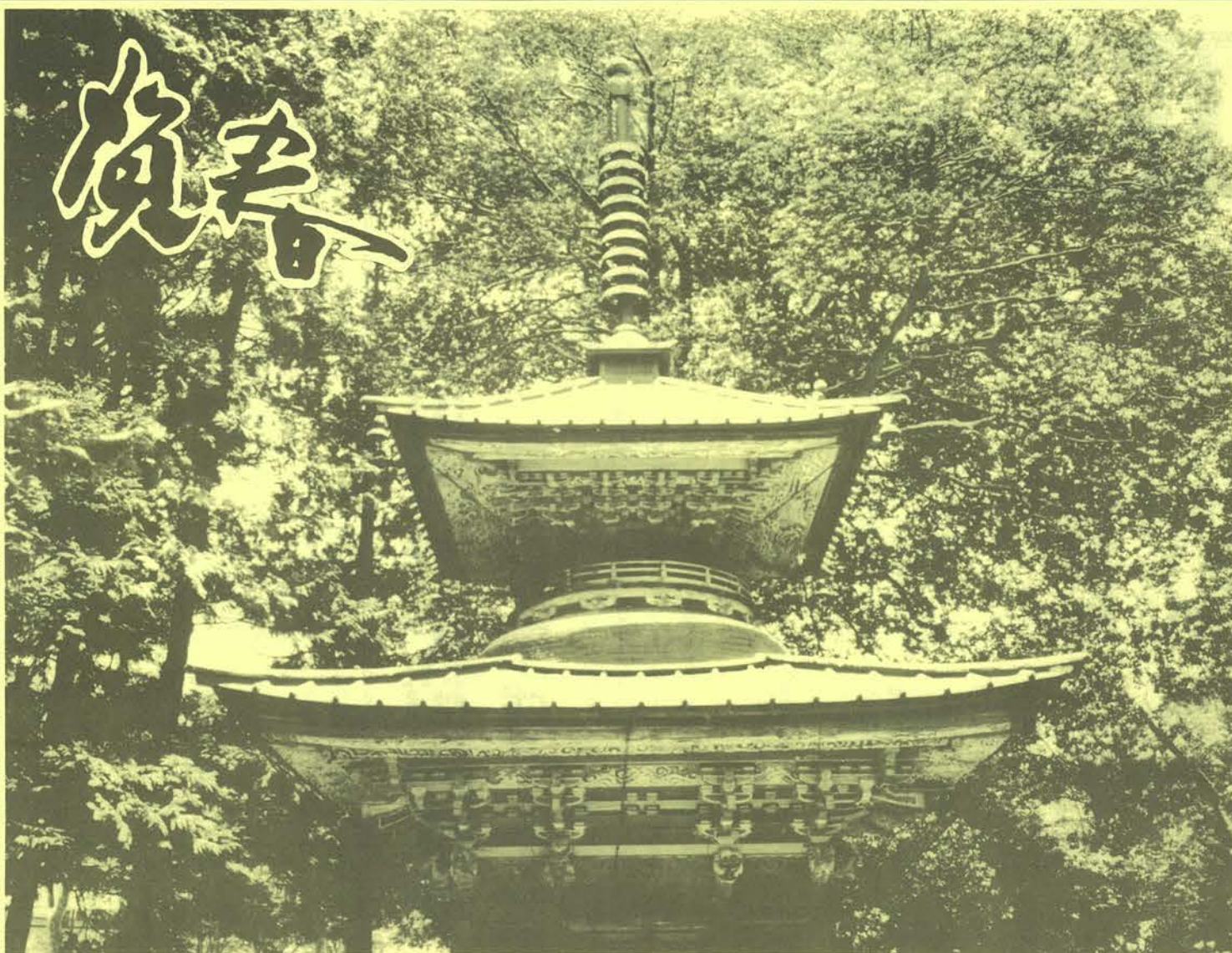
冬の多宝塔 (福島市文知摺観音)