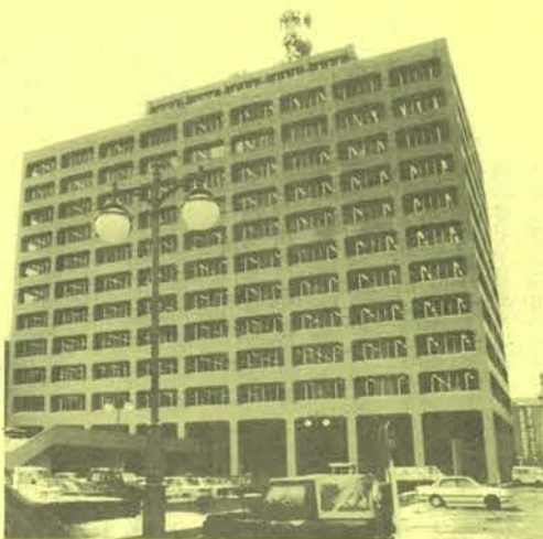
県庁西庁舎前に設置された外灯

また、ふくしまの姿づくりとして本県のイメージに呼応した後世に残るような芸術的・文化的資産と成り得る公共建築物を建設するため、今年も「つくしまふくしま公共建築懇話会」を開催し、利用者を含めた各界、各層の方々からの意見を聞きながら公共建築の整備の在り方を検討し、新たな設計指針を作成していきたいと考えております。 なお、昨年に引き続き、石材、木材、瓦、設備機器等の県産材の積極的な活用を図り、地域の産業振興に貢献していきたいと考えて