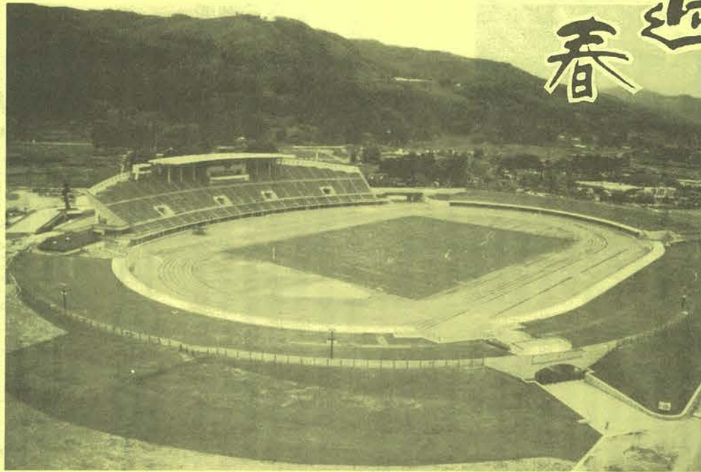
ふくしま国体秋季大会の開・閉会式場となる県あづま陸上競技場