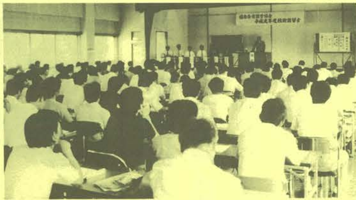
各社の現場代理人ら 250名が熱心に受講した講習会