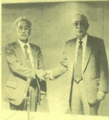
ガッチリと握手する新旧理事長

伴う電気工事士の資格取得を急ぐとともに、より一層の経営努力が求められていることから、新しい活動を通して活路を見出し、いかなければならない」と組織活動の重要性を述べるとともに、「私の団体役員生活が今年で三十年になるので後進に道を譲りたい」と勇退を表明した。