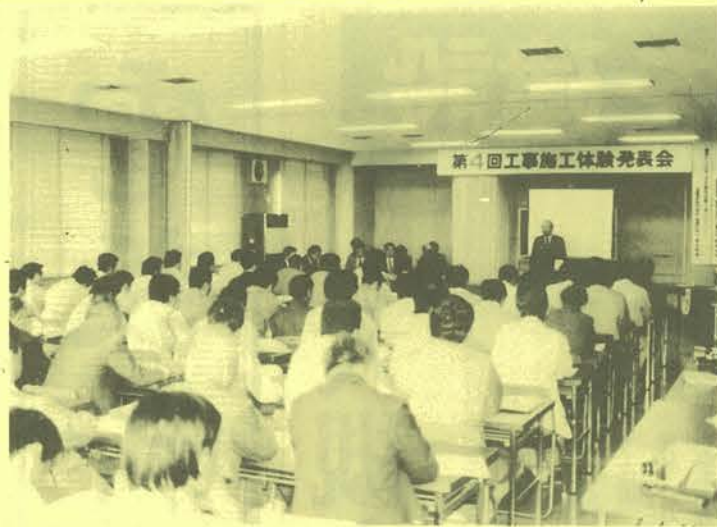
第4回工事施工体験発表会