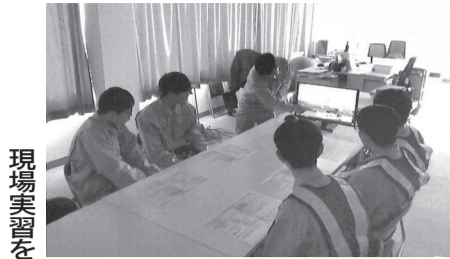
現場実習を行う生徒ら

最後にこの実習を通して感じたことは、自分のやりたいことができる会社に入社することが一番会社を選ぶ上で大切だと思いました。どこでもいいという考えではなく自分が興味を持った会社を選ぶのがいいとわかりました。