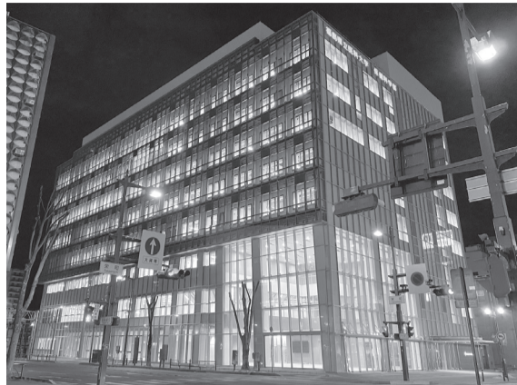
完成した県立医科大学保健科学部(左)と会津保健福祉事務所