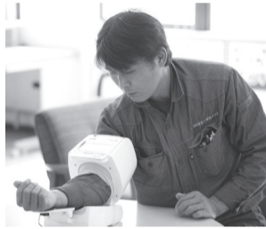
社員と共に取り組むに

先日、経済産業省の「健康経営優良法人2021(プライム500)」の認定をいただきました。数年前から、人生100年時代、定年後も健康かつ充実した人生を送れるようにと始めた取り組みが実を結びました。