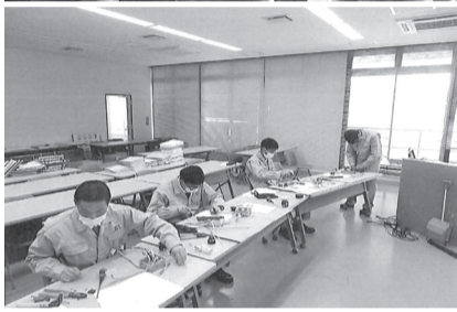
校の生徒が参加したが、2年度は新型コロナウイルスの感染を防止する観点から4