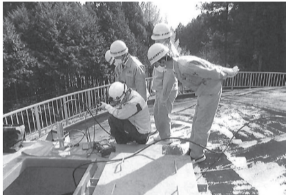
事、目黒工業商會、佐藤電