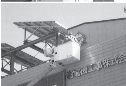
部会員10社で社会人として