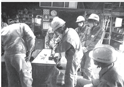
校・高等技術専門学校計9

令和2年度のインターンシップ（職業体験学習）支援事業は、新型コロナウイルス感染症の影響を受けて、県立テクノアカデミー会津と勿来工業高校の2校での実施にとどまった。 インターンシップは会津支部で平成8年度から実施していたが、協